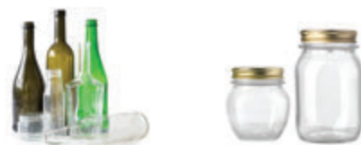
БУТИЛКИ И БУРКАНИ ОТ НАПИТКИ И ХРАНИ