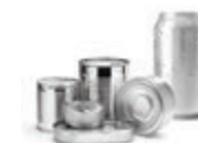
КОНСЕРВИ И КЕНОВЕ